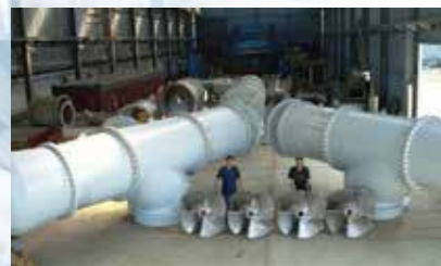
Bombas de Agua del tipo Axial, Mixto y Francis para caudales de hasta 16000 litros por segundo.