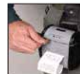
RECAUDACION CON TARJETA DE CREDITO