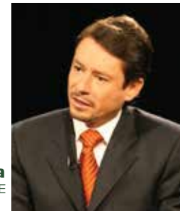
Esteban Albornoz Vintimilla MINISTRO DE ELECTRICIDAD Y ENERGÍA RENOVABLE

UN DESAFÍO COMPLEJO Y A LA VEZ IMPOSTERGABLE