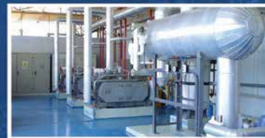
SALA DE MÁQUINAS, COMPRESORES DE PISTONES, SISTEMA DE RECIRCULACIÓN MANTA

DISEÑO, EQUIPAMIENTO, MONTAJE Y FINANCIACIÓN DE PROYECTOS LLAVE EN MANO