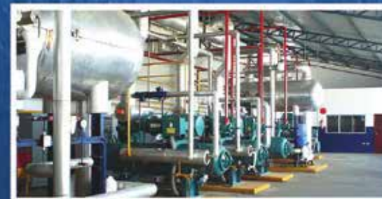
SALA DE MÁQUINAS, COMPRESORES DE TORNILLO, SISTEMA DE RECIRCULACIÓN MANTA

APOYANDO A LA INDUSTRIA PESQUERA DEL ECUADOR