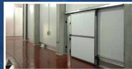
CÁMARAS FRIGORÍFICAS POSORJA