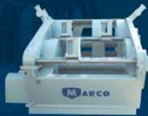
WINCHE CERQUERO WS-380