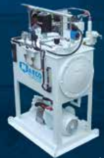
UNIDAD DE PODER HIDRÁULICO