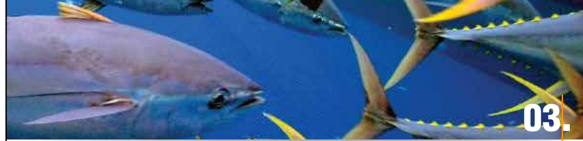
ABB ECUADOR S.A.

Dirección: Av. Atahualpa y Av. 10 de Agosto, Ed. Atahualpa Business Center, Piso 10 y 11