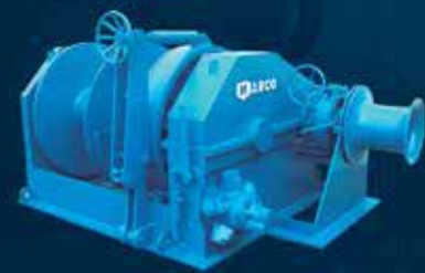
WINCHE WAR 070