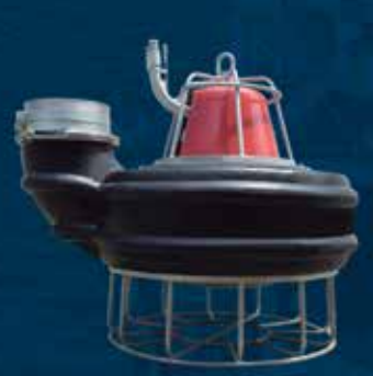
CAPSUL PUMP 2610

Descripción de su compañía / servicios: Venta y Distribución de Productos para Refrigeración Industrial y Comercial así como climatización.