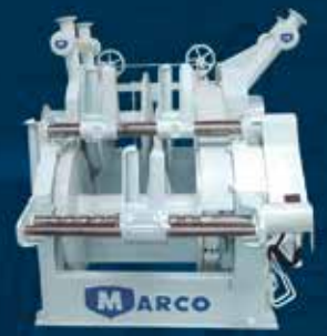
WINCHE CERQUERO WS-180