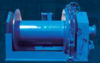
WINCHE DE REMOLQUE WRR - 080