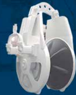
POWER BLOCK PB - 42 2M